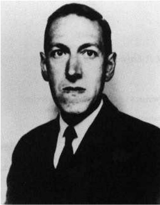
Howard Phillips Lovecraft

Nacimiento: Estados Unidos, 20 de agosto de 1890.